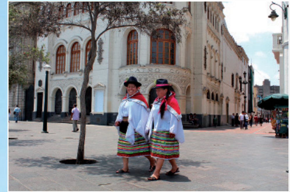
Vista de la gran Catedral de Lima y el Palacio Arzobispal, en la Plaza Mayor. En la foto superior, damas de etnia ayacuchana pasan delante del antiguo teatro Colón camino a la plaza San Martín para iniciar fiesta costumbrista.

el señorío de Ichma. La cultura Maranga y la cultura de Lima fueron las que se establecieron y forjaron una identidad en estos territorios. Identidad que en muchos lugares aún se mantiene. A continuación, en la expansión del imperio Wari se construye el centro ceremonial de Cajamarquilla pero su declinación posterior da lugar a la cultura Chancay. En el siglo XV, estos territorios fueron incorporados al imperio incaico. Encontramos los huacas, asentamientos interesantes que se localizan en distintos lugares de la ciudad, rodeados de edificios residenciales y oficinas. Uno de ellos el Huaca Pucllana se sitúa en uno de los mejores restaurantes de la ciudad. Quizás se debiera decir que el restaurante es el que se localiza en la Huaca. Aconsejamos una visita gastronómica a este lugar.