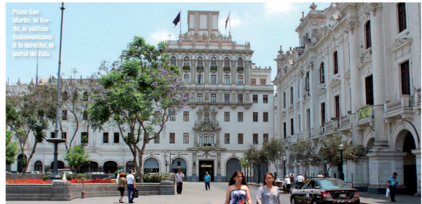
Plaza San Martín. Al fondo, el edificio Sudamericana. A la derecha, el portal de Zela.

Entre los edificios que hay que destacar y que el visitante de esta gran ciudad no debe perderse está el Gran Hotel Bolívar inaugurado en 1924 y que se cuenta que allí nació la creación del Pisco Souer, la bebida bandera del Perú. Se dice que John Wayne y Ava Gardner es-