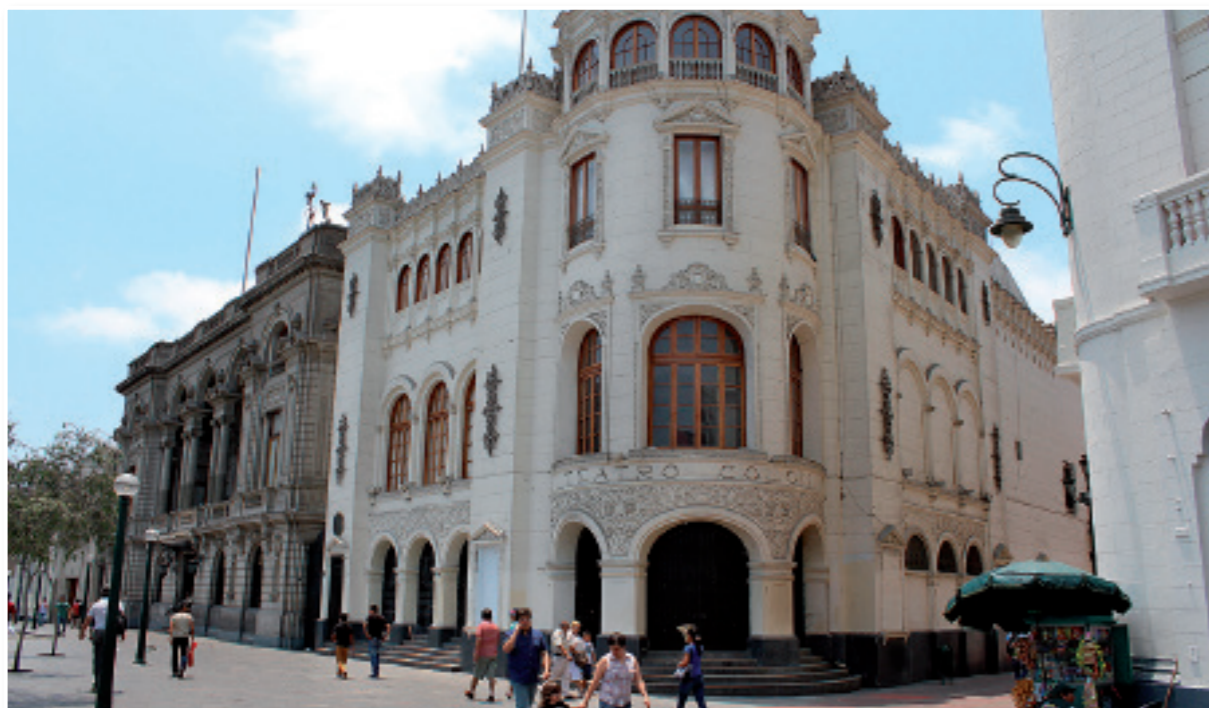
El antiguo Teatro Colón, de bella arquitectura art nouveau. A su izquierda, el Club Nacional.