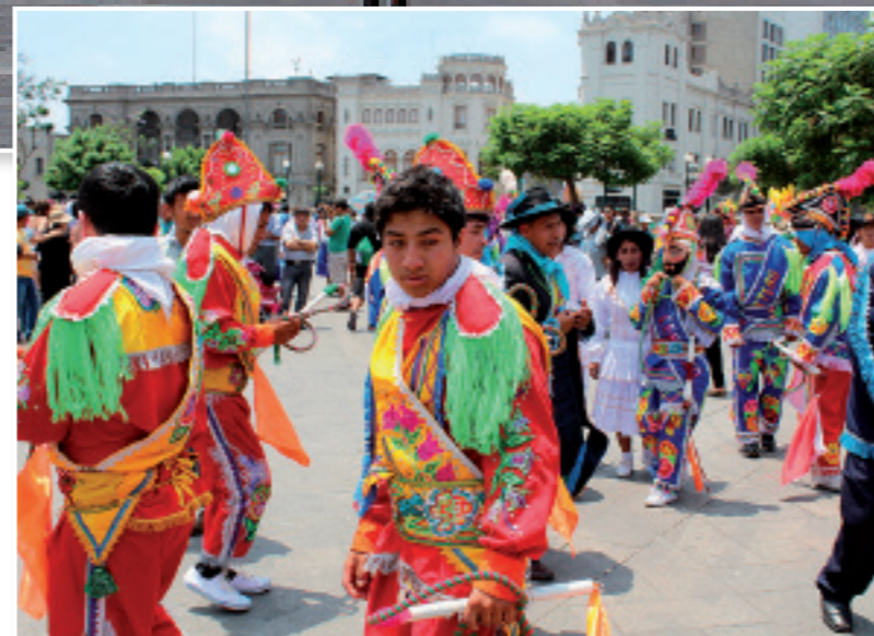
Preliminares a una fiesta costumbrista. Los trajes son de la etnia Wari.

La Casa Aliaga es la casa más antigua de Lima, data de 1535 propiedad de don Jerónimo de Aliaga (uno de los trece del Gallo y fundador de Lima) y después de 17 generaciones sigue siendo de la misma familia, tal vez la única propiedad en la ciudad que ha pertenecido a una sola familia en toda su historia. La fachada es de estilo colonial y republicano.