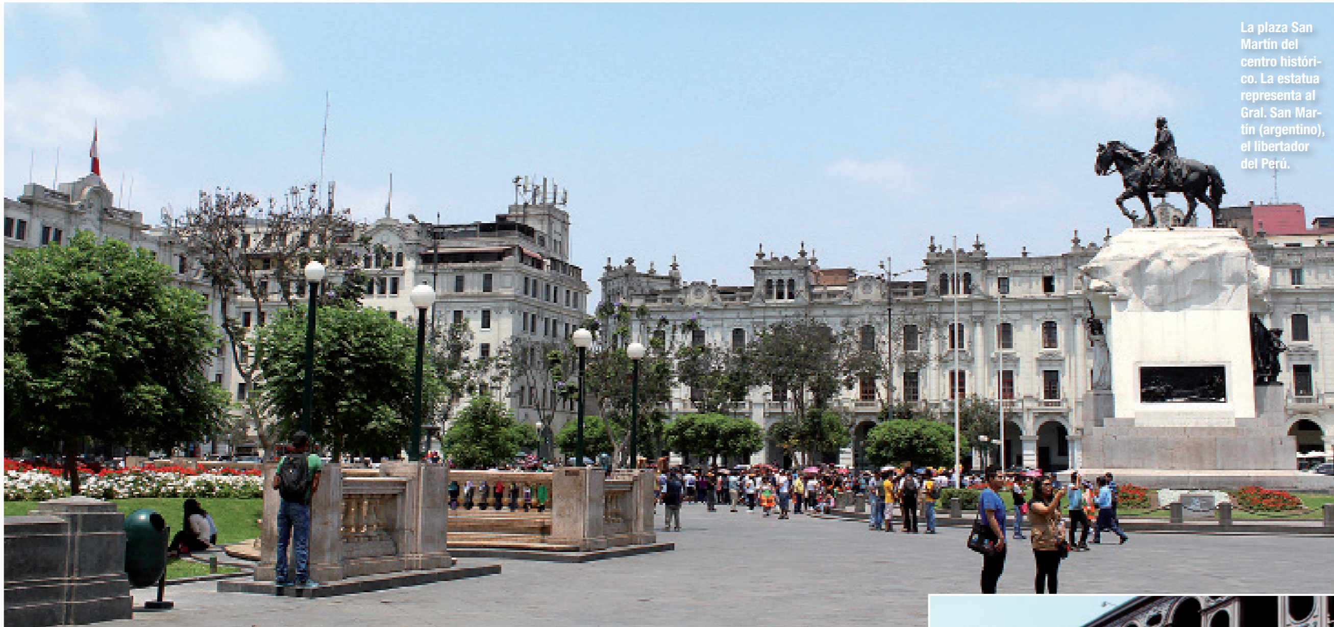
La plaza San Martín del centro histórico. La estatua representa al Gral. San Martín (argentino), el libertador del Perú.