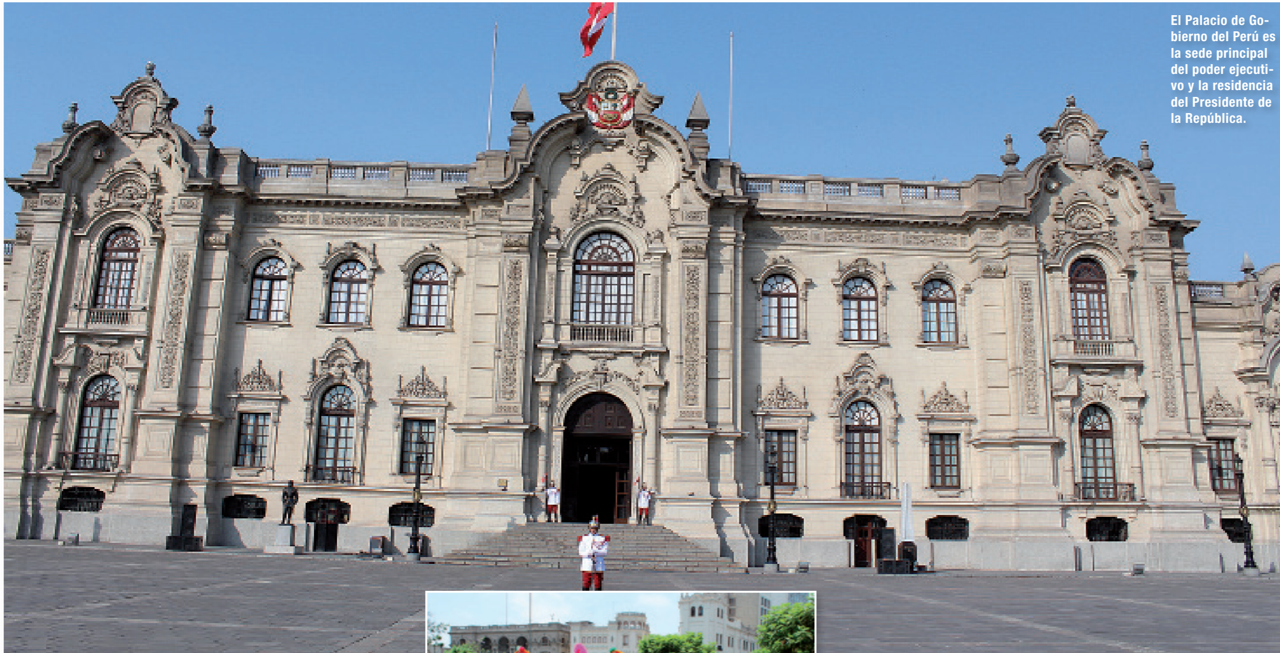
El Palacio de Gobierno del Perú es la sede principal del poder ejecutivo y la residencia del Presidente de la República.