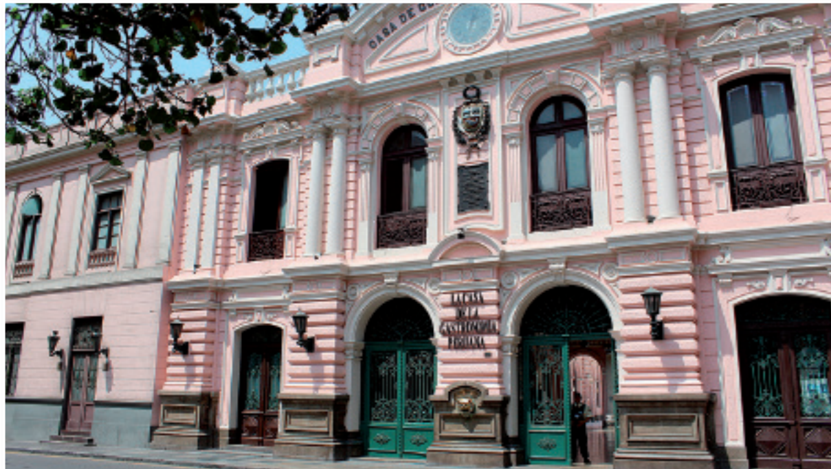
La antigua Casa de Correos y Telégrafos ocupa la cuadra siguiente al Palacio de Gobierno.