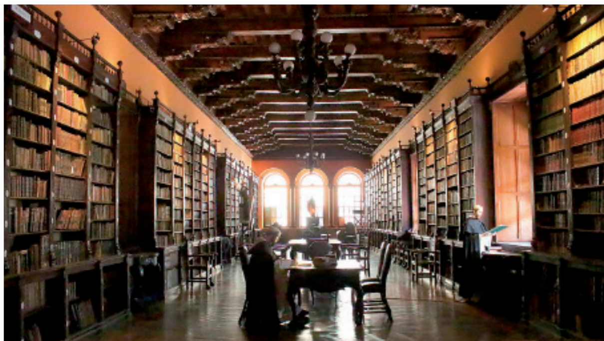
Biblioteca del Convento de Santo Domingo. En su rica estantería se hallan numerosos incunables.

mente el edificio. Siempre la ciudad se ha vuelto a levantar sobre sus ruinas, dando ejemplo de tesón y esfuerzo. Sin embargo mantuvo la disposición y plantas que Pizarro diseñó tras la fundación de Lima, y que se llevó a cabo en el lugar donde hoy se extiende la Plaza Mayor.