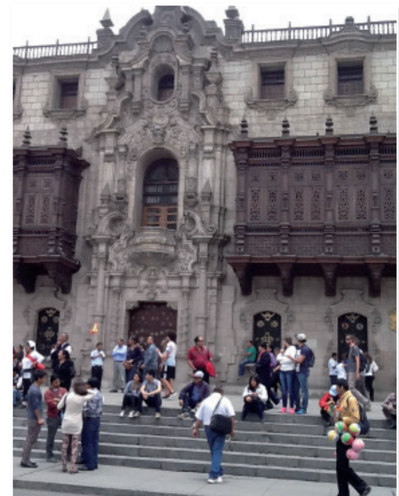
Turistas frente a la fachada del Palacio Arzobispal de Lima.