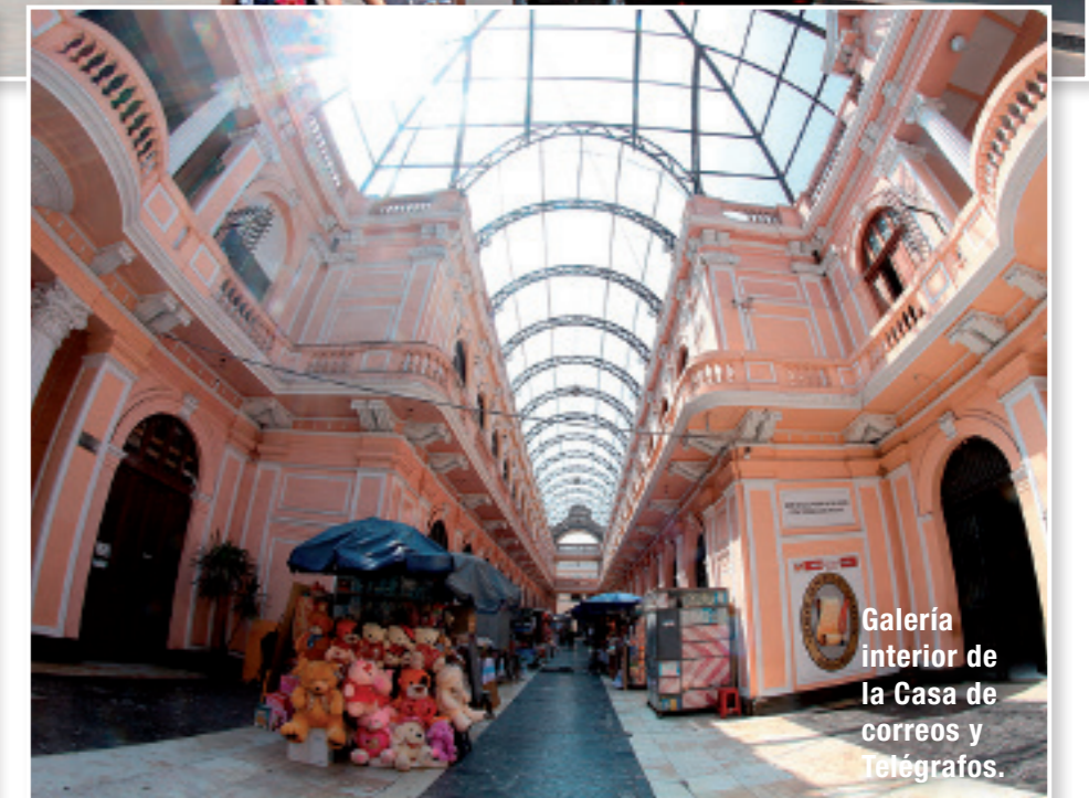
Galería interior de la Casa de correos y telégrafos.