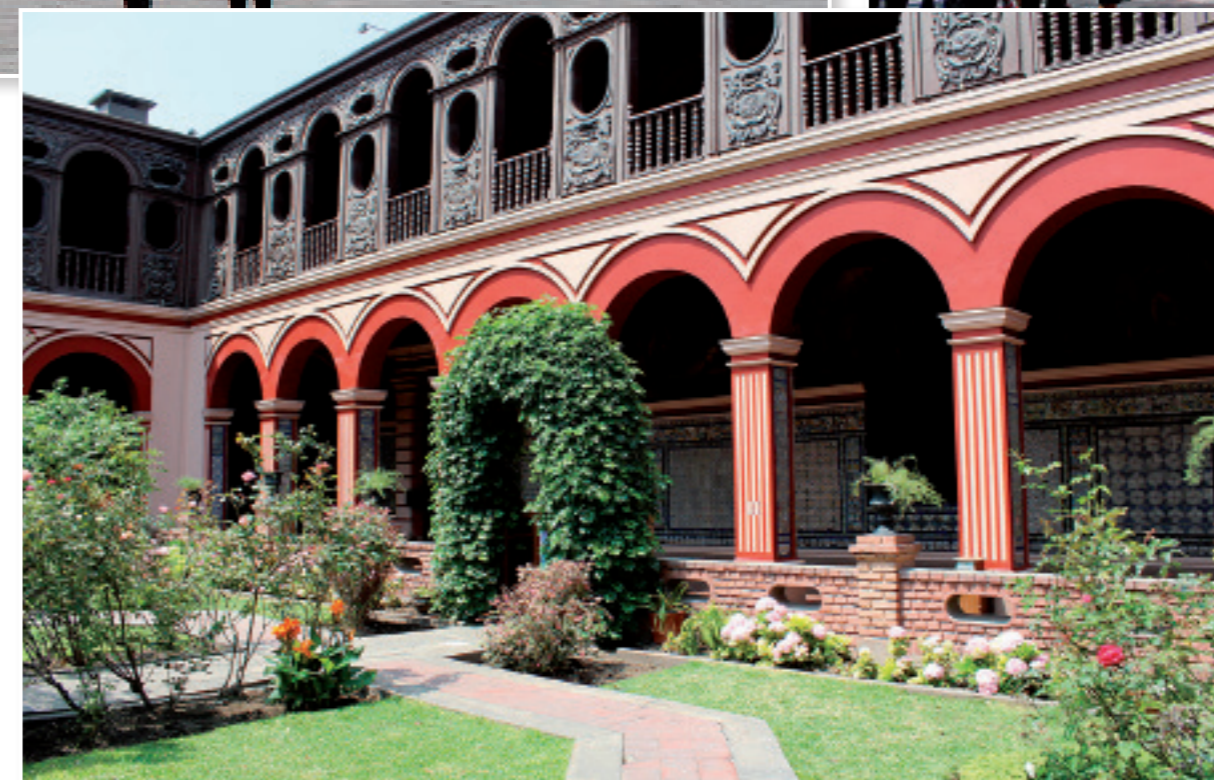
Claustro principal del convento de Santo Domingo, de cuatro galerías, decoradas con azulejos sevillanos.

tistas argentinos y chilenos dirigidos por el general Don José de San Martín desembarcó en el sur de Lima en 1820, aunque no llegaron a atacar la ciudad. Ante esta perspectiva, temiendo un levantamiento popular y careciendo de medios para imponer el orden, el Consejo de la Ciudad invitó a San Martín a entrar en la ciudad, firmando una Declaración de Independencia. La ciudad cambió de manos en los años siguientes. Sin embargo el general San Martín proclamó la independencia del Perú en 1821 por lo que Lima se convirtió en la capital de la República del Perú. Los primeros años de la historia republicana peruana se caracterizaron por el constante enfrentamiento entre caudillos militares que querían tomar el poder y convertirse en dictadores políticos. En la Guerra del Pacífico, entre 1881 y 1883 Lima fue ocupada por fuerzas chilenas. A principios del siglo XX se inició la construcción de avenidas que sirvieran para el desarrollo de la ciudad. Se diseñaron avenidas como el Paseo de la República, Leguía (hoy llamada Arequipa), Brasil